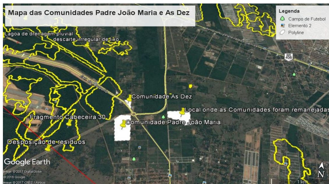
Figura 3: Localização das antigas comunidades As Dez e Padre João Maria.

A equipe de fiscalização da SEMURB, realiza o monitoramento das zonas de ruído e a compatibilização do uso do solo, conforme o código municipal de meio ambiente, do Plano Diretor participativo e da Lei de Zoneamento das ZPAs, em consonância com o PEZR, homologado pela ANAC. No entanto em 2021, não foi registrado, nessas ações de fiscalização incompatibilidade relacionada ao uso do solo e as diretrizes do PEZR. Quando convocados, participamos das incursões nas áreas de influência do PEZR com a SEMURB, além de conciliamos as vistorias em ASA para trata da temática do risco da fauna, para averiguar possíveis inconsistências no uso e ocupação do solo incompatíveis com zoneamento do ruído, conforme RBAC 161.03.