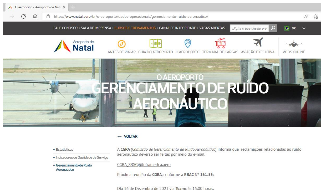
Figura 2: Página do Gerenciamento de Ruído Aeronáutico de ASGA.

O e-mail disponibilizado é CGRA_SBSG@inframerica.aero .