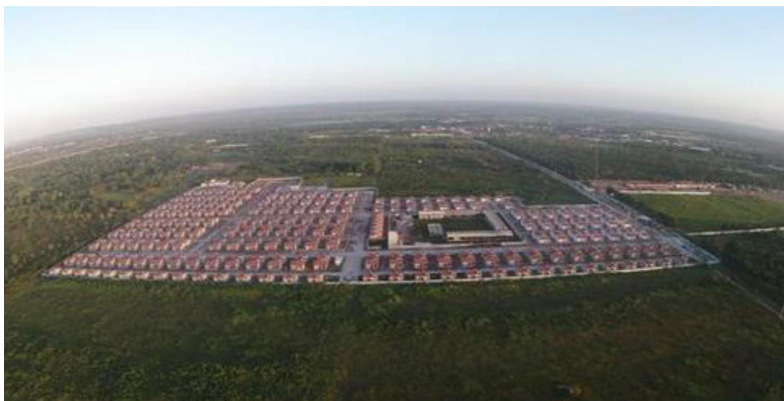
Figura 5: Nova área que recebeu os moradores de Padre João maria e As Dez.