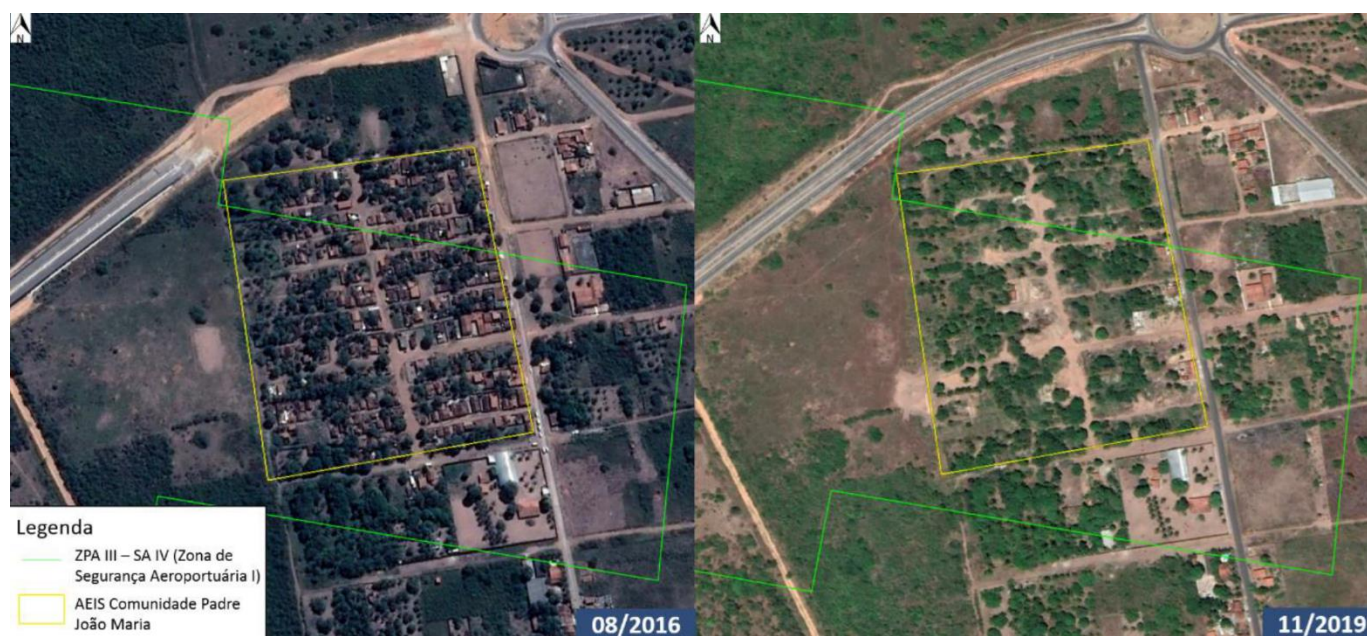
Figura 4: Comparativos de antes e depois da remoção das famílias para a nova área disponibilizada pela prefeitura.